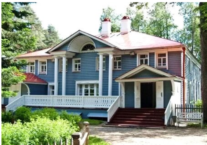
УСАДЬБА А. Н. ОСТРОВСКОГО В ЩЕЛЫКОВЕ