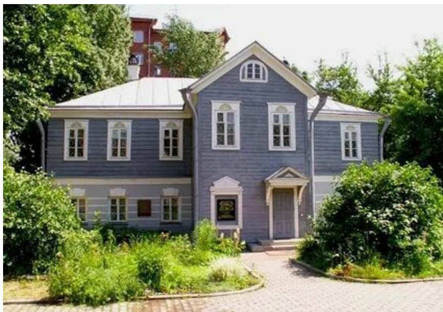
ДОМ-МУЗЕЙ А. Н. ОСТРОВСКОГО В МОСКВЕ