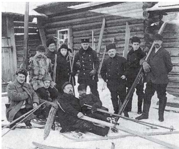
Члены общества велосипедистов на лыжной прогулке