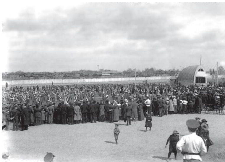
Гимнастический парад в Екатеринбурге. 1914 г.