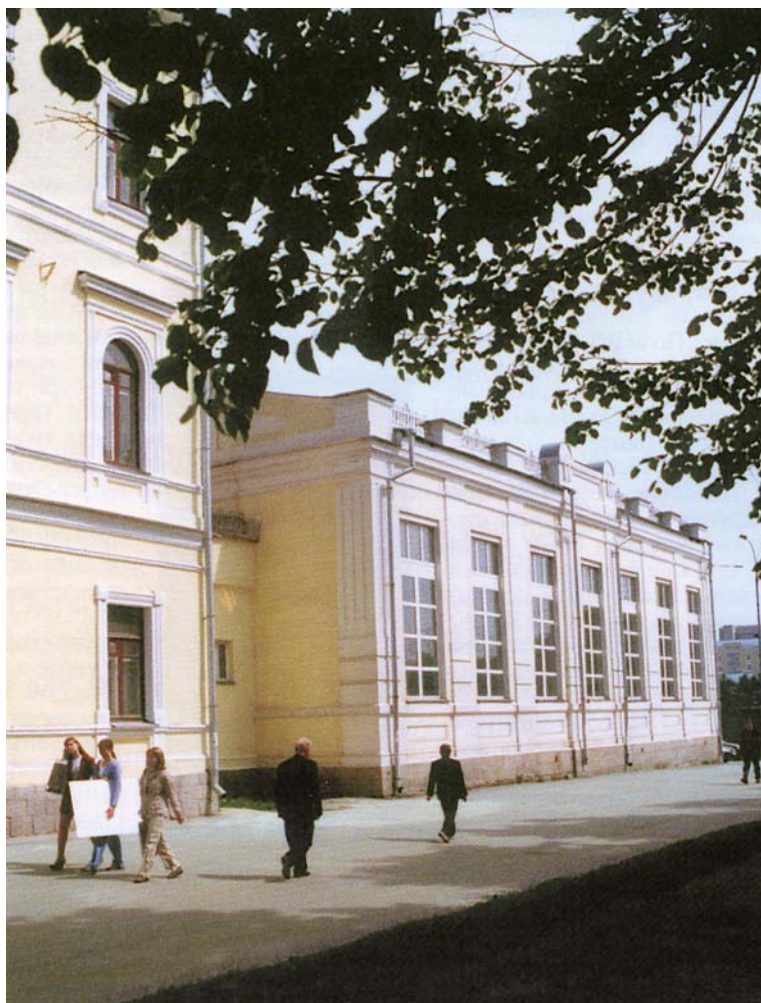
Тот самый первый спортивный зал, пристроенный к зданию мужской гимназии (вид после реконструкции)

В 1912 г. в мужской гимназии города (современная гимназия № 9) построен первый спортивный зал. В этом же году в гимназиях и других учебных заведениях города введен новый предмет «Физическая культура». Для его преподавания из Праги выписан учитель, специалист по так называемой «сокольской гимнастике».