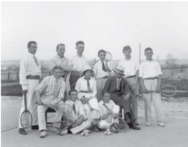
Любители тенниса были в Екатеринбурге и до революции 1917-го, но большого распространения этот вид спорта в то время еще не получил