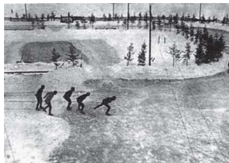
Каток на льду городского пруда