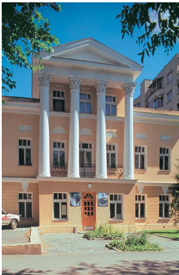
Дом главного лесничего уральских заводов (ныне Дом мира и дружбы)

общее было подчинено исключительно власти главного начальника горных заводов Уральского хребта. Но, не имея аналогов, в целом военно-административная система управления горнозаводским Уралом лишь отражала общие тенденции развития России николаевского периода.